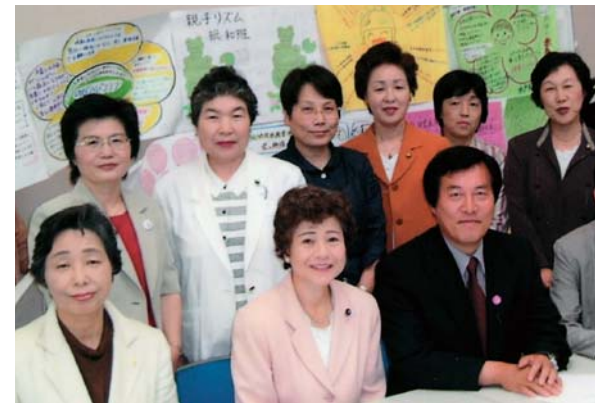
乳幼児医療費助成で県に申し入れ

私は兵庫県南光町人口約4,500人の小さな町で、ひまわり栽培をし「美しい日本の村景観コンテスト」で国から表彰され、「町民の健康づくり、休耕田、放棄田の解消、花いっぱい町づくり」を目指していると知って、那珂市の参考にしようと早速行ってみました。2002年(平成14年)、ちょうど祭りの期間で県内外から大勢の観光客が大型バスや乗用車で来ていました。ひまわり油で作った特産品や地元農産物もたくさん売っていました。