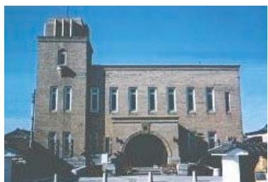
常陸太田市郷土資料館

高校生を中心に住民とともにがんばった「田立電鉄線」を守る運動は残念な結果となりましたが、この運動は水郡線を守るという運動に引き継がれています。また、宮の郷工業団地内に計画されている民間のPCB処理施設は、住民の「危険なPCB処理施設はいらない」の声の高まりで市長は県に「反対の意見書」を提出しました。住民参加のまちづくりが大切です。住民署名によって実現した、史上初の住民投票を成功させ、新しい市政と議会をつくり、住みよいまちづくりをすすめるために、みんなで力をあわせてがんばりましょう。