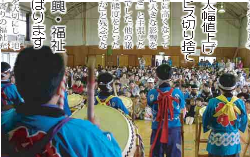
郡戸小学校三世代ふれあい教室

で、金砂郷の歴史や伝統を大切にし、地域の振興と子どもやお年寄りの福祉充実にがんばります。ご支援を心からお願ひします。