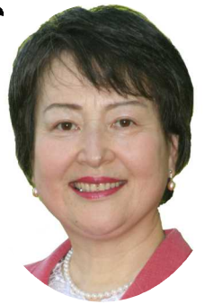
日本共産党 宇野たか子議員

宇野議員の一般質問は 14日(金)の午前11時30分ごろからになる予定です。なお、午後は1時開始です。