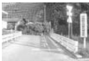
高萩高校入り口に設置されたカーブミラー