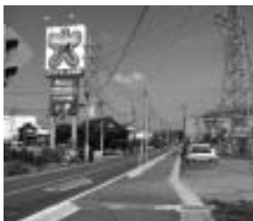
歩道が完成した市道1661号線

市道1661号線（県営住宅南側）の歩道整備、市道1132号線（本町ファミリー公園～手綱サンユーストア）の側溝ふた掛け整備、カーブミラーの設置など実現させました。