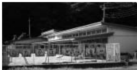
市内の唯一の公立保育所として存続した高萩保育所