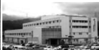
06年4月より開院した県北医療センター高萩協同病院