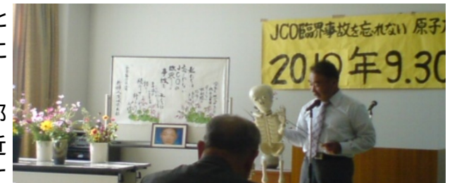
2010年9.30茨城集会オープニングの腹話術

集会では、原発の危険性について国も電力会社も住民と認識を共有すべきであることや、日本に国際基準による原子力施設の安全規制機関を、推進機関から分離・独立して確立する必要性などが強調されました。