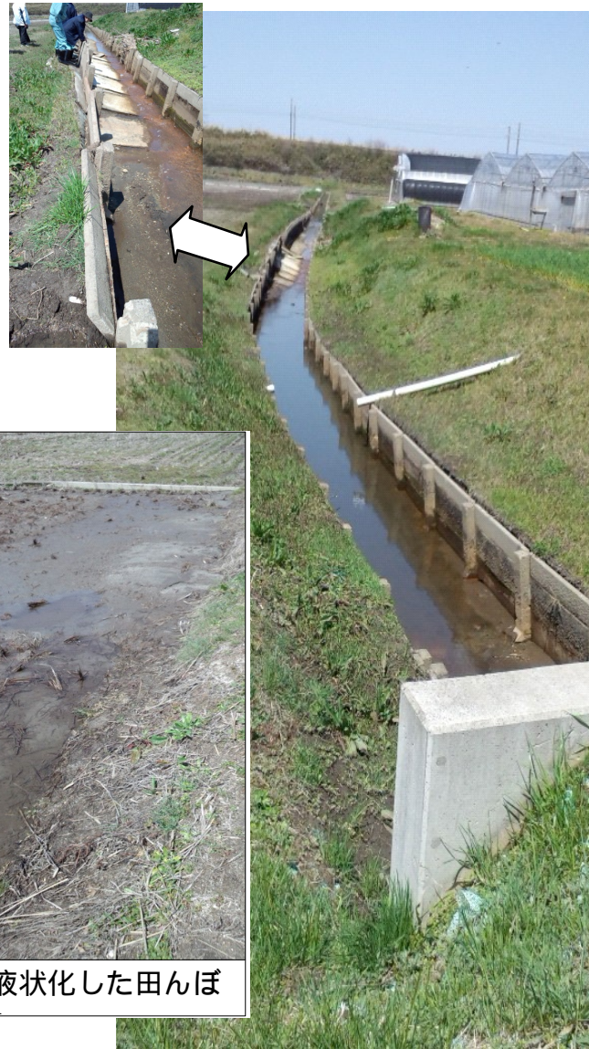
液状化した田んぼ