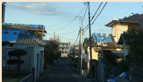
ブルーシートで覆われた家並み

村内の業者に頼めば、地域の活性化 にもつながります。県内で始まった助 成、見舞金制度をご紹介します。