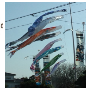
大空を彩るこいのぼり