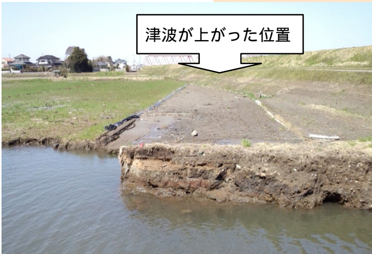
津波が上がった位置

村は、激甚災害対策費補助の申請を行い、国の認定待ちとなっています。どれだけの補助金になるのかわからないようですが、しっかりした助成を求めていきたいと思います。