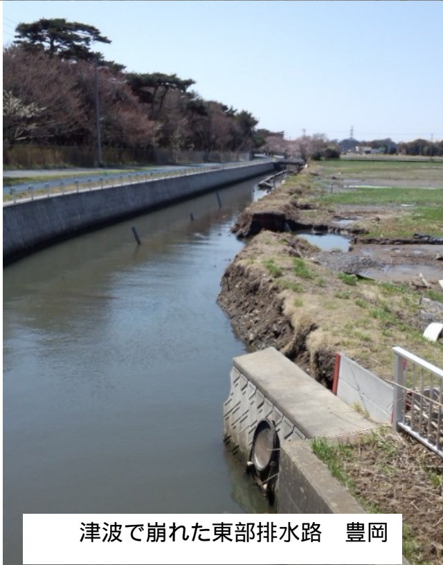
津波で崩れた東部排水路 豊岡