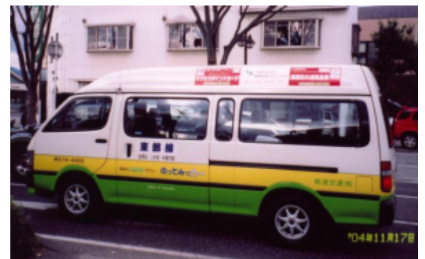
福島県保原町「のってみっカー」

ご意見ご質問があれば、ぜひお寄せください。12月議会では導入にあたっての調査委託費(NTTへ)が補正で計上されました。