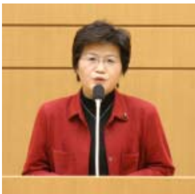
昨年12月議会での一般質問時

3月議会の日程予定は次のとおりです。 村政へのご意見・ご要望などぜひ、お寄せ下さい