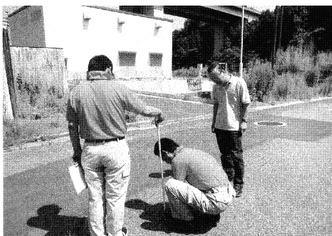
放射線測定に立ち会う平正三議員