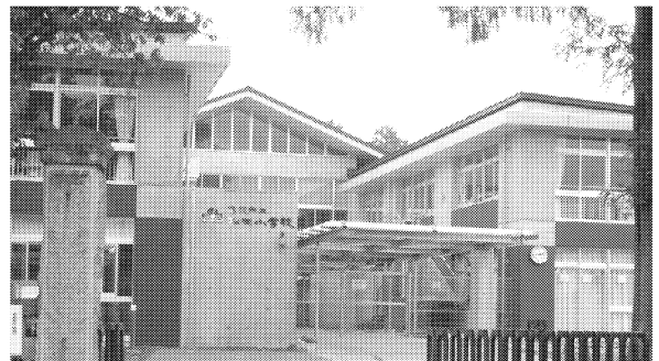
改築された松岡小学校校舎

小中学校施設の耐震化を一貫して要求し、震災直前に松岡小学校校舎・高萩中学校体育館の改築が実現しました。(2011年度に東小学校体育館・秋山中学校体育館の耐震補強・改修を実施します。)