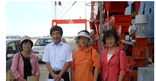
うの周治党政策委員長と

東京湾の補完的役割を担う港として整備されてきた常陸那珂港。北埠頭は、日立建機とコマツの両者が製造した大型建設機械の“専用積み出し港”となっていました。無駄遣いの実態がみえました。