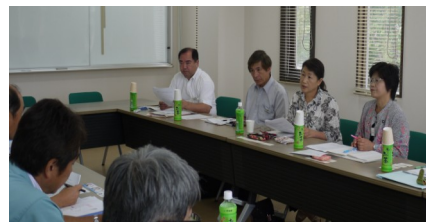
9.6 JCOへの聞き取り調査と申し入れ

村政懇談会において、戸別受信機を今後ラジオ付き受信機に変えていく予定と回答。具体的見通しは、