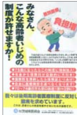
県医師会のポスター

今月から始まった後期高齢者医療制度、政府は急きょ「長寿医療制度」と名づけました。保険証は届いたでしょうか。「封筒が来てたが、なんだかわからず見ないでいた」と封筒を開かずにいた人、また「75歳にならないのに、後期高齢者の保険証がなんで送られてきたのか、さっぱりわからない」と驚く肢体不自由の障がいのある方。65歳～74歳の障がいのある方は、選択性で後期高齢者医療制度の加入対象者になりました。15日には、年金から保険料の天引きがはじまります。こんな国民だましの制度は中止・廃止しかありません。日本共産党は、いま署名を呼びかけています。ご一緒に力を合わせましょう。