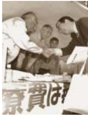
制度廃止を求めて座り込む お年寄りを激励する志位和 夫党委員長 = 厚生労働省前

6月村議会に提出された、後期高齢者医療制度の中止・撤廃を求める請願書は、文教厚生委員会に付託され審査中です。「高齢者の医療費削減を目的とするこの制度は、『早く死ぬ』と言わんばかりの制度であり、人の道に反するもの。中止・撤廃してほしい。政府に意見書を提出して下さい」。私は、請願にこめられた村民の皆さんの心からの怒りと願いをしつかり受け止め、委員会で主張し、採択にむけ全力で頑張ります。7月4日(金)1時半から、文教委員会において紹介議員と請願代表者の趣旨説明が予定されています。ぜひ傍聴にお越し下さい。