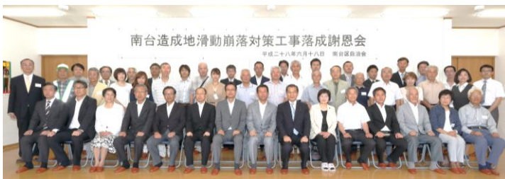
出席者全員での集合写真（前列右から6番目が私）

6月18日、南台区自治会が挙行した「南台造成地滑動崩落対策工事落成謝恩会」に、招待をいただき出席しました。