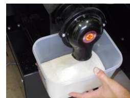
JA 東海会館内 7/12

3月議会で予算化された JA 生産部会育成事業にもとづき、JA 常陸に米粉製粉機が納品されました。