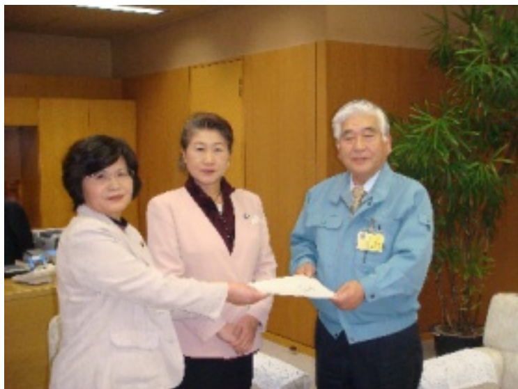
12月15日、要望書を手渡す党村議団